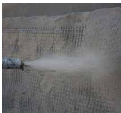
1 Reparação e Reforço de Estruturas com Projecção Automática ou Manual