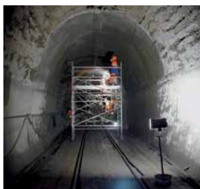
2 Túneis, Canais e Passagens Hidráulicas