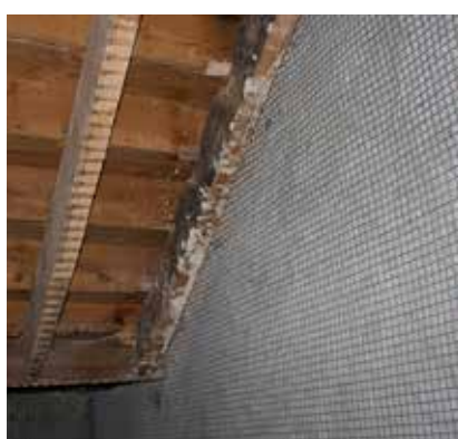
5 Edifícios antigos (Alvenarias Tradicionais)