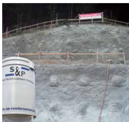
4 Obras Geotécnicas (Escavação, muros de suporte)

Software e Manuais de dimensionamento / Referências / Dados técnicos / Especificação / Relatórios de Ensaios / Publicações