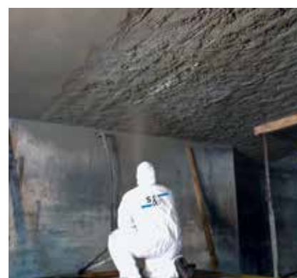
3 Reforço em Construções (Aumento de Segurança)